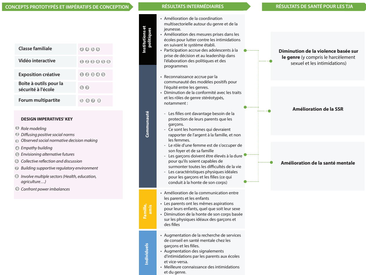
Gambar 2: Teori perubahan sebagai teori kerja setelah uji medium-fidelity

Ces cinq concepts sont présentés dans la théorie du changement qui illustre la manière dont chaque concept peut améliorer les résultats sanitaires à moyen et à long terme (voir figure 2).